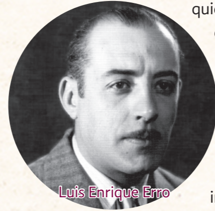
Luis Enrique Erro