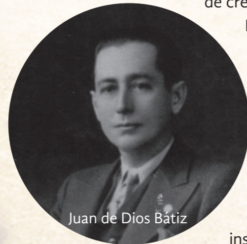
Juan de Dios Bátiz

de la Escuela Politécnica: el primero, referente a la construcción y adaptación de los edificios; y el segundo, relacionado con el estudio de los programas de enseñanza. Sin embargo, se hizo evidente que la creación de la Escuela Politécnica superaba el potencial del personal directivo y técnico del DETIC, lo que llevó a Gonzalo Vázquez Vela, secretario de Educación Pública a ordenar la integración del Consejo Técnico de la Escuela Politécnica para lograr mayor efectividad en los trabajos de creación de la nueva institución.